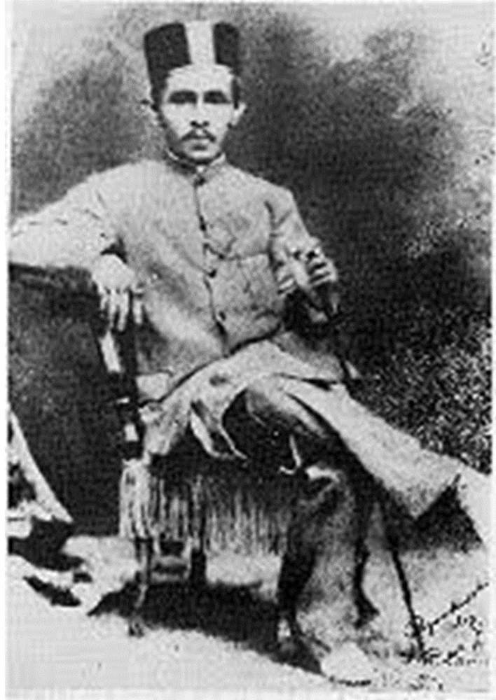
Sultan Ahmad al-Mu'azzam Shah ibni al-Marhum Bendahara Sri Maharaja Tun Ali