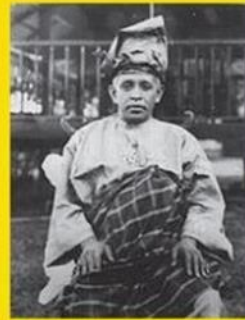
Sultan Abdullah Al-Mu'tassim Billah Sultan Pahang III