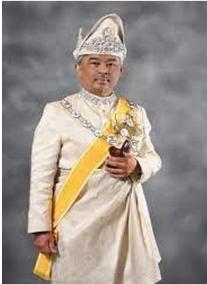
Al-Sultan Abdullah Ri'ayatuddin Al-Mustafa Billah Shah ibni Almarhum Sultan Haji Ahmad Shah Al-Musta'in Billah