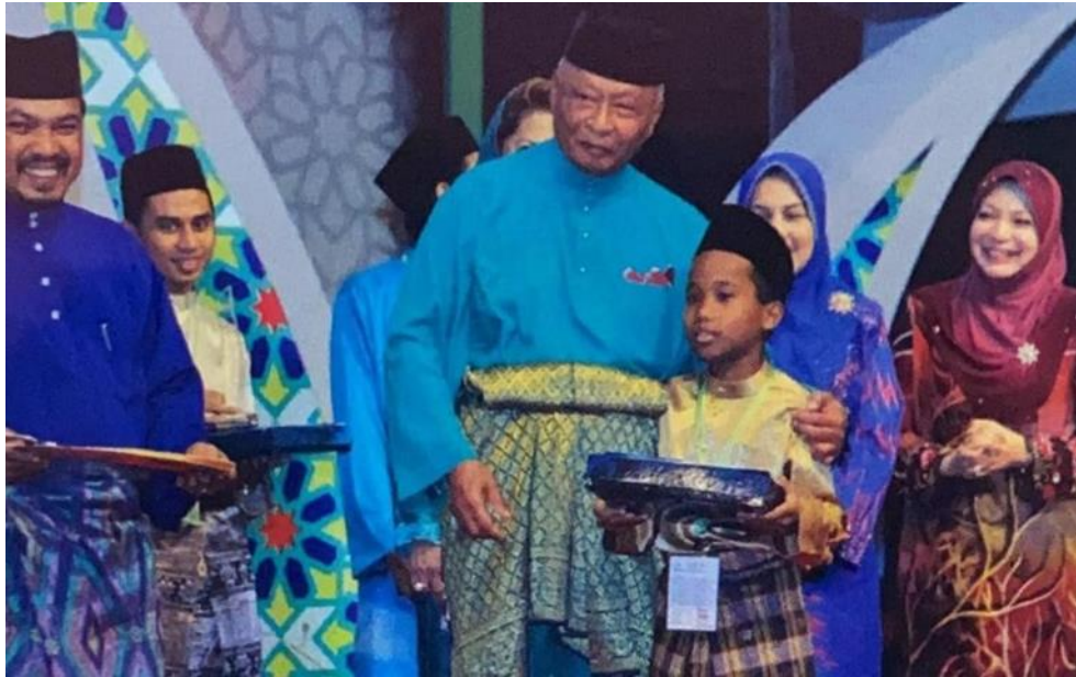
GAMBAR ALMARHUM MENCEMAR DULI MERASMIKAN KOMPLEKS ASNAF MAJLIS UGAMA ISLAM DAN ADAT MELAYU PAHANG DI KAMPUNG SUNGAI SOLI, KUANTAN.