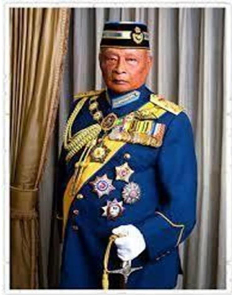
Sultan Haji Ahmad Shah Al-Musta'in Billah ibni Almarhum Sultan Abu Bakar Ri'ayatuddin Al-Mu'azzam Shah