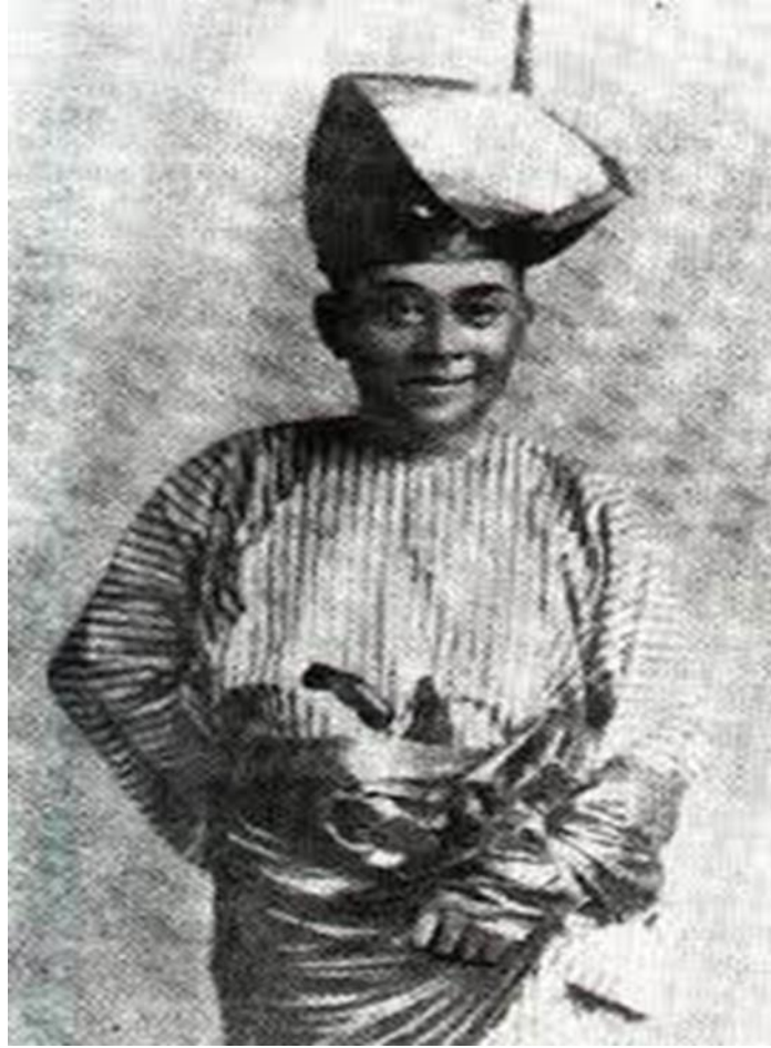
Sultan Mahmud Shah ibni al-Marhum Sultan Ahmad al-Mu'azzam Shah