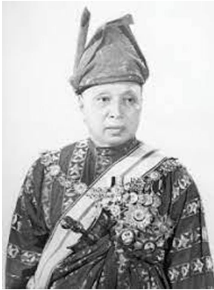
Sultan Abu Bakar Ri'ayatuddin al-Mu'azzam Shah ibni al-Marhum Sultan Abdullah al-Mu'tasim Billah Shah