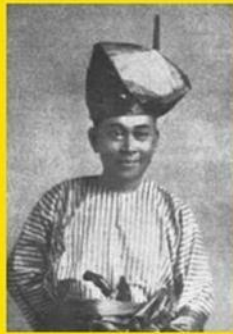
Sultan Mahmud Sultan Pahang II