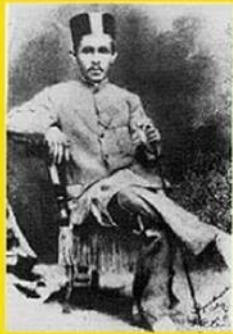
Sultan Ahmad Al-Mu'adzam Shah Sultan Pahang I