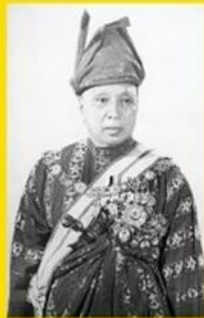
Sultan Sir Abu Bakar Ri'ayatuddin Al-Mu'adzam Shah Sultan Pahang IV