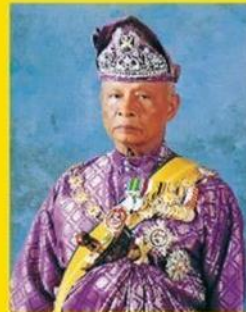
Sultan Haji Ahmad Shah Al-Musta'in Billah Sultan Pahang V