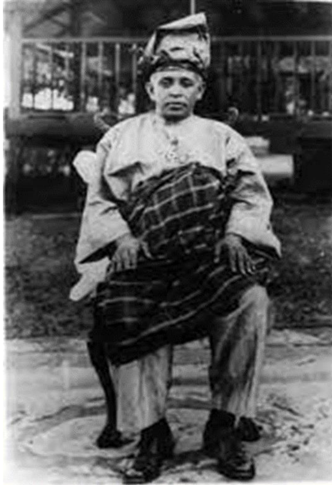
Sultan Abdullah al-Mu'tasim Billah Shah ibni al-Marhum Sultan Ahmad al-Mu'azzam Shah